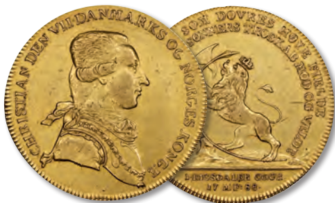
DENMARK/NORWAY. 20 Ducats, 1788-MF. Christian VII. Fr-unlisted. Bruun-7894. NGC AU Details.