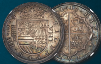
Spain: Philip III 8 Reales 1618 (Aqueduct)-A