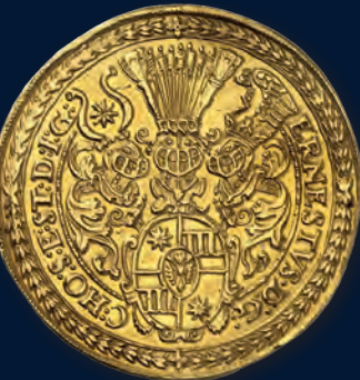
Los 86 - Grafschaft Holstein-Schauenburg Ernst III., 1601-1622. 10 Dukaten o. J., Altona. Von allergrößter Seltenheit. Scharf ausgeprägtes Exemplar mit feiner Goldpatina, vorzüglich. Schätzung: 100.000 Euro