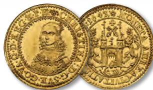
SWEDEN. Livonia. Ducat, 1643-HW. Christina. Fr-9b. Bruun-11984. NGC MS-61.