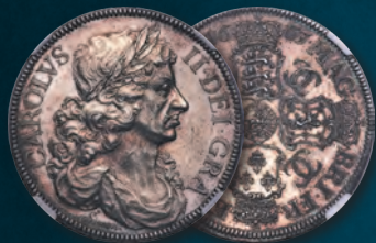
Great Britain: Charles II silver Pattern "Petition" Crown 1663 MS62 NGC