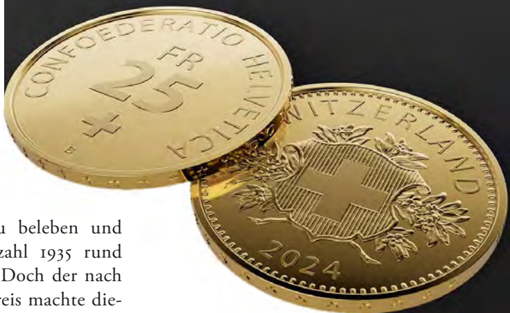
25 Franken in Gold, ausgegeben am 1. November 2024 von der Swissmint.

Diese besondere Münze ist nicht auf der World Money Fair zu haben. Ihre offizielle Ausgabe findet nämlich erst am 1. Juli 2025 statt. Aber die Swissmint hat eigens für die World Money Fair einen exklusiven Münzsatz in Stempelglanz-Qualität geschaffen, der eine WMF-Medaille in Polierter Platte enthält und mit einer Auflage von nur 500