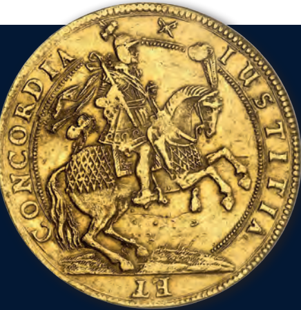
Los 53 - Fürstentum Braunschweig-Lüneburg-Celle Christian, Bischof von Minden, 1611-1633. Löser in Gold zu 20 Dukaten o. J. (1611-1633), Winsen an der Luhe. Geprägt mit den Stempeln des Löasers zu 2 Reichstalern. NGC AU 55. Von allergrößter Seltenheit. Wohl Unikum. Von herausragender geldgeschichtlicher Bedeutung. Feine Goldpatina, fast vorzüglich. Schätzung: 250.000 Euro