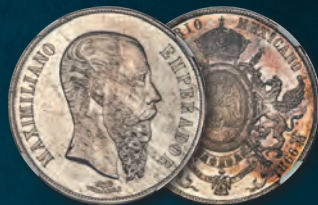
Mexico: Maximilian silver "Small Letters" Pattern Peso 1866-Mo MS66+ NGC