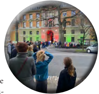
Großer Andrang vor der Swissmint bei der Berner Museumsnacht 2023.

Dort bietet die Swissmint die aktuellen Sondermünzen der Schweiz an, Sondermünzen, die das Bild einer modernen Schweiz transportieren. Denn Heidi und Alpöhi gehören schon längst der Vergangenheit an. Die Schweiz, das sind internationale Forschungsprojekte wie das Cern; das ist Präzision wie beim Bau des Gotthard-Basistunnels; das ist eine stabile Währung und eine der produktivsten Volkswirtschaften der Welt.