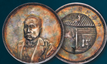
China: Republic Hsu Shih-chang Specimen "Pavilion" Medallion Dollar Year 10 (1921)