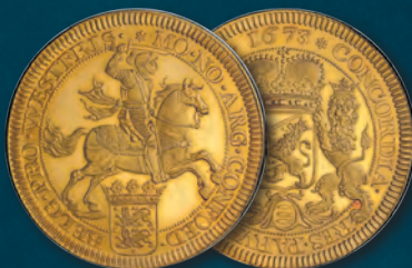
Netherlands: West Friesland. Provincial gold Specimen Pattern Ducaton (Silver Rider) 1673 SP63 PCGS