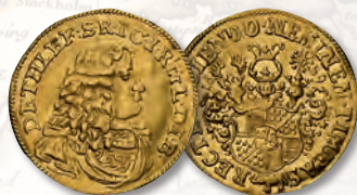
GERMANY, Rantzau, Ducat 1689. Detlef. Fr-2450. Bruun-15064 NGC AU-53.