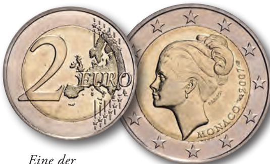
Eine der großen Raritäten der 2 Euro-Stücke ist dieses Stück aus Monaco auf Grace Kelly.

Dabei stellte sich heraus, welch immensen Rolle die Höhe einer Auflage spielt.