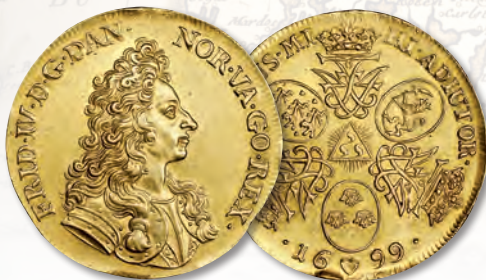
DENMARK. 10 Ducats, 1699. Frederik IV. Fr-213. Bruun-7296. NGC MS-60.

Auction lots will be available for viewing in the United States and in Europe in advance of the auction.